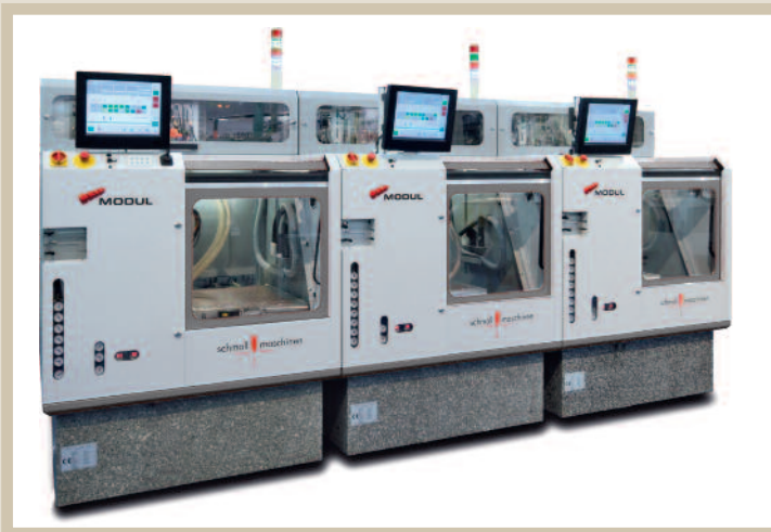
Bild 6. Produktivität in Reihe: Bewährte Linien- und Automationskonzepte machen die Serienfertigung besonders wirtschaftlich

Zyklen und High-End-Funktionen zur Verfügung. Derzeit ist die Maschine als 3-Achs-Maschine ausgeführt, an einem 5-Achs-Simultankonzept wird bereits gearbeitet.