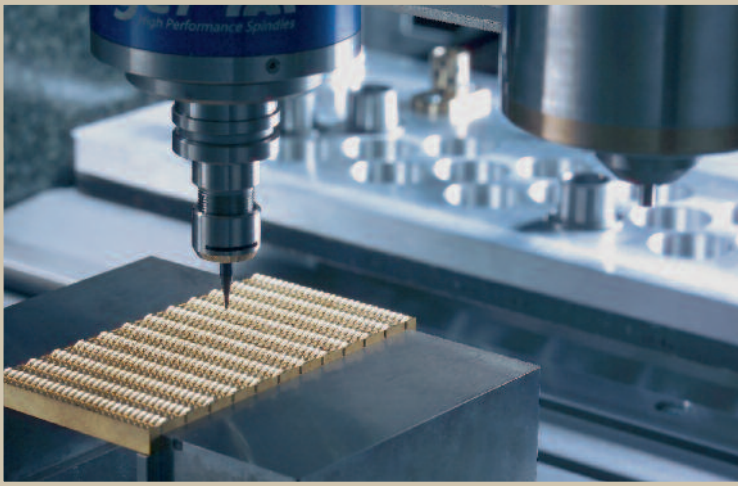
Bild 3. Mit der Kraft von zwei Spindeln: Ein Doppelspindelkonzept erleichtert die Grob- und die Feinbearbeitung ohne Umspannen des Werkstücks

Ein wichtiger Aspekt bei der HSC-Bearbeitung sind die Achsen, genauso wichtig ist jedoch die zur Verfügung stehende Spindeldrehzahl. Besonders bei der Bearbeitung von gehärteten Stählen mit CBN-Werkzeugen und kleinen Werkzeugdurchmessern bildet hier die verfügbare Spindeldrehzahl eine Grenze. Aus diesem Grund ist die MicroMill mit bis zu zwei Spindeln ausgestattet ( Bild 3 ). So kann mit der wälzgelagerten Präzisionsspindel und einem Messerkopf oder mit einem Kugelfräser vorgefräst werden ( Bild 4 ). Im Anschluss daran kann das Werkstück mit einer Hochfrequenz-Frässpindel und einer Drehzahl von bis zu 300\,000\text{ min}^{-1} gefinisht werden ( Bild 5 ). Für den Anwender bedeutet das, dass er mit hohen Zerspanleistungen (bis 5 kW) und mit hohen Drehzahlen und Schnittgeschwindigkeiten ohne Umspannen arbeiten kann. Das Doppelspindelkonzept ist besonders dann von Vorteil, wenn ein breites Bauteilspektrum bearbeitet werden soll.