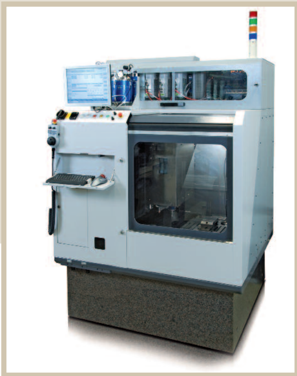
Bild 2. Geringe Aufstellfläche, großer Bearbeitungsraum: Mikrofräsmaschine »MicroMill« von Schmolz Maschinen

konstruktiv an den Fräsprozess angepasst und mit einem neuen Steuerungssystem versehen ( Bild 2 ).