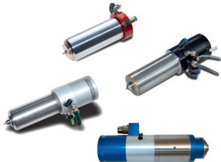
Bild 5. Mikrofräsen mit der Spindel nach Maß: Die Auswahl der Motorspindel richtet sich ganz nach der jeweiligen Anwendung. Aero-statisch gelagerte Spindeln erreichen Drehzahlen bis 300\,000\text{ min}^{-1}

Damit auch ein Upscaling in die Massenproduktion möglich ist, stellt Schmoll bewährte Linienkonzepte bereit ( Bild 6 ). Die Maschine ist vom Grundaufbau her so designt, dass mehrere Maschinen zu einem Fertigungscluster in einer Reihe zusammengestellt werden können. Trotzdem können alle Maschinen beschickt und von vorne gewartet werden. Hierdurch ergibt sich eine optimale Ausnutzung